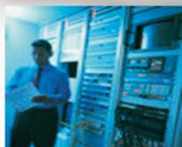
AUTOMAZIONE FORZA LAVORO