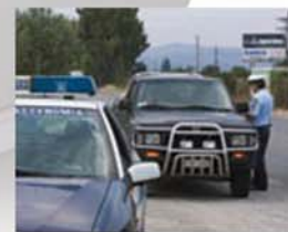
GOVERNO/ SETTORE PUBBLICO