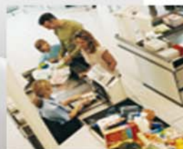
VENDITA AL DETTAGLIO